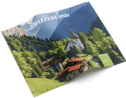
Ansicht des fertigen Brillentuchs